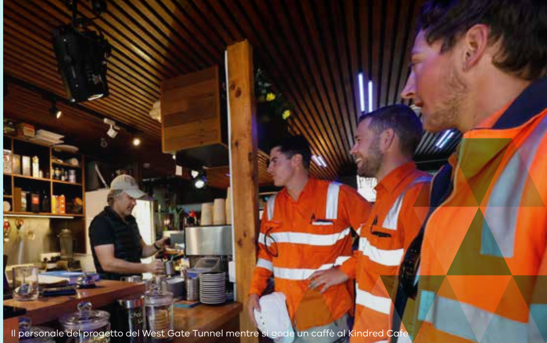
Il personale del progetto del West Gate Tunnel mentre si gode un caffè al Kindred Cafe

Lo spostamento del collettore di fognatura di North Yarra sulla Whitehall Street a Footscray/Yarraville comporterà deviazioni del traffico nell'area per 12 mesi.