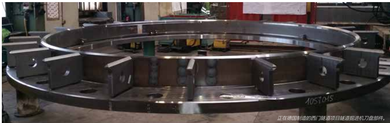
正在德国制造的西门隧道项目隧道掘进机刀盘部件。