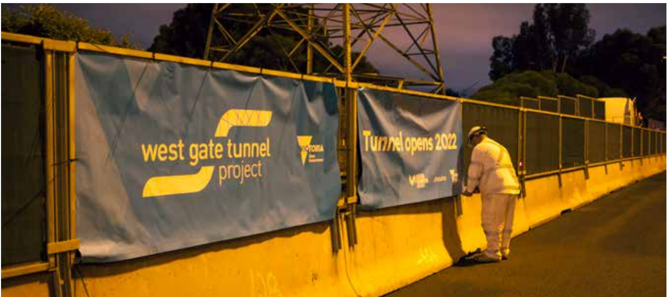
工人在高速公路上安装交通路障。

如需关于行车状况变化以及即将发生的车道和匝道关闭的信息，请访问网站 westgatetunnelproject.vic.gov.au 。