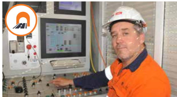
Đường hầm: Andrew Lawer

Sau nhiều năm tham khảo ý kiến cộng đồng và thiết kế, Frances rất vui mừng khi thấy các thiết kế sẽ thành hiện thực vào cuối năm nay khi việc xây dựng đang được tiến hành để lắp đặt các bức tường chống tiếng ồn mới.