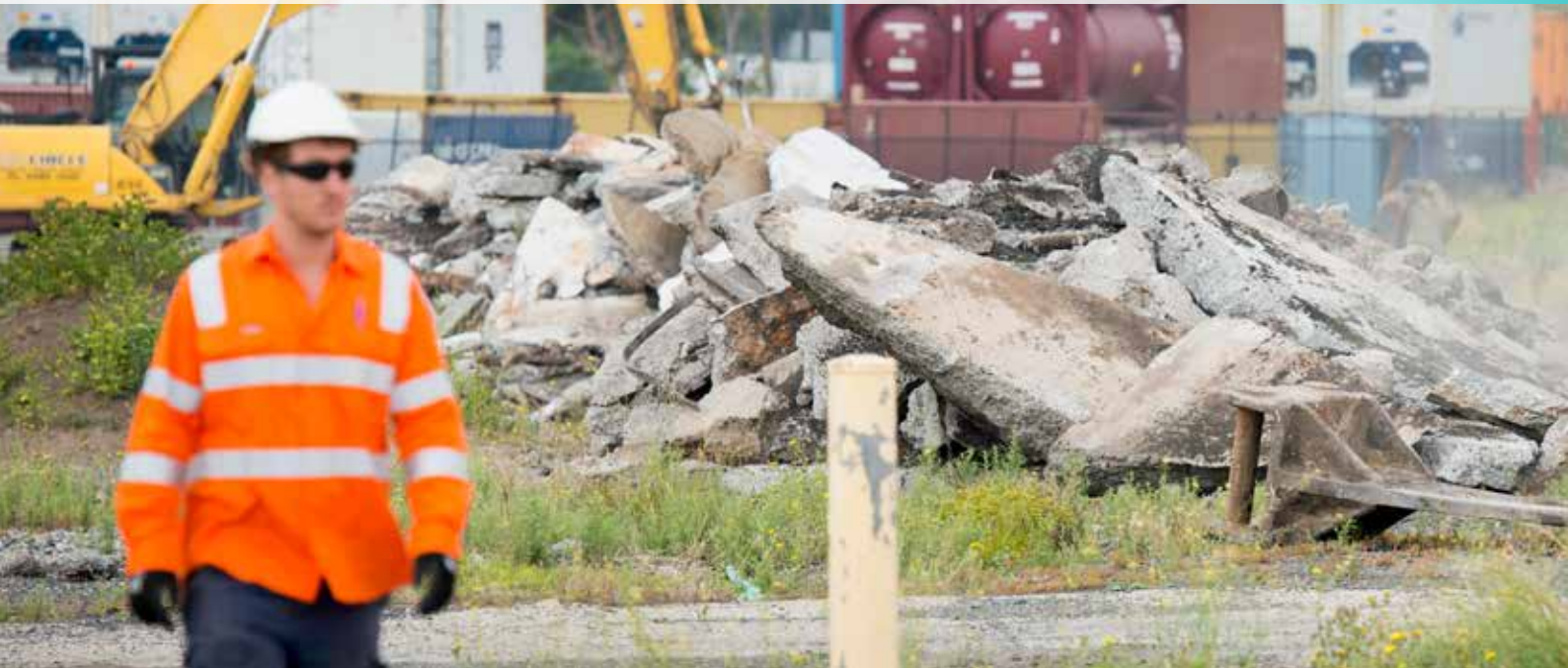
Công trình tại Cổng phía Bắc, Footscray.