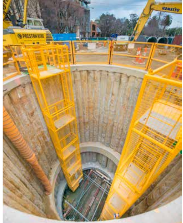
Hệ thống cống thoát nước chính của South Yarra được di dời phục vụ Dự án Đường hầm Metro.

Để biết thêm thông tin và bản đồ tuyến đường vòng, xem westgatetunnelproject.vic.gov.au