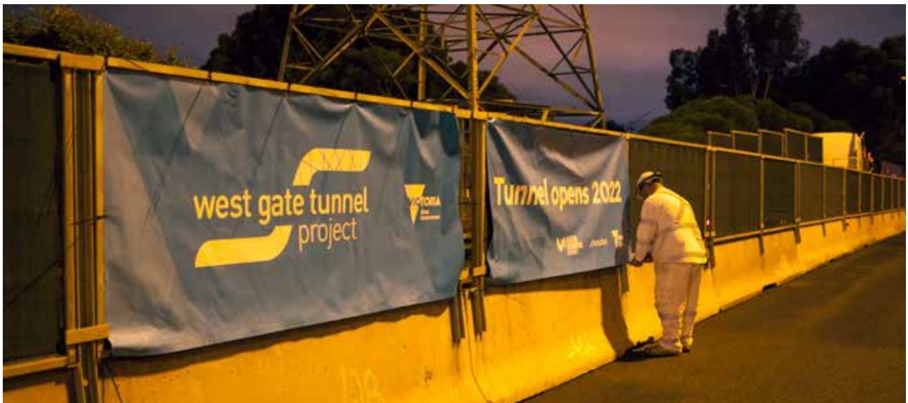
Công nhân đang lắp đặt các rào chắn giao thông trên xa lộ.

Để biết thông tin về các thay đổi điều kiện lái xe và đóng cửa sắp tới các làn xe và các đường dốc nối vào cao tốc, hãy xem westgatetunnelproject.vic.gov.au