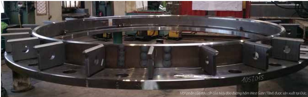
Một phần của đầu cắt của Máy đào đường hầm West Gate (TBM) được sản xuất tại Đức.