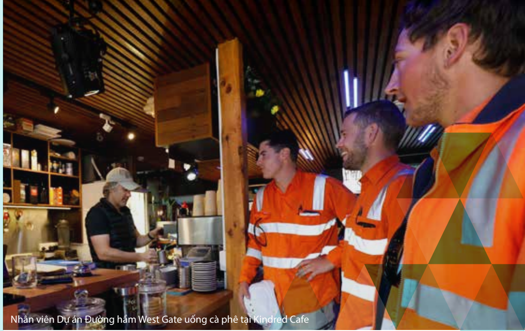
Nhân viên Dự án Đường hầm West Gate uống cà phê tại Kindred Cafe

Việc di dời Hệ thống Cống rãnh Chính của North Yarra trên đường Whitehall Street sẽ khiến cho xe cộ phải đi đường vòng ở khu vực này trong 12 tháng.