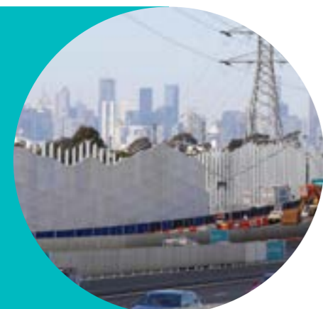
Τοποθέτηση ηχοφραγμάτων κοντά στην έξοδο του Williamstown Road.

Το 2020 ήταν μια χρονιά σαν καμία άλλη. Ενώ υπήρχε λιγότερη κυκλοφορία στους κεντρικούς δρόμους κατά τη διάρκεια των περιορισμών για τον Κόρονοϊό, τα συνεργεία συνέχισαν να εργάζονται εντατικά για να πετύχουν μερικά σημαντικά κατασκευαστικά ορόσημα.