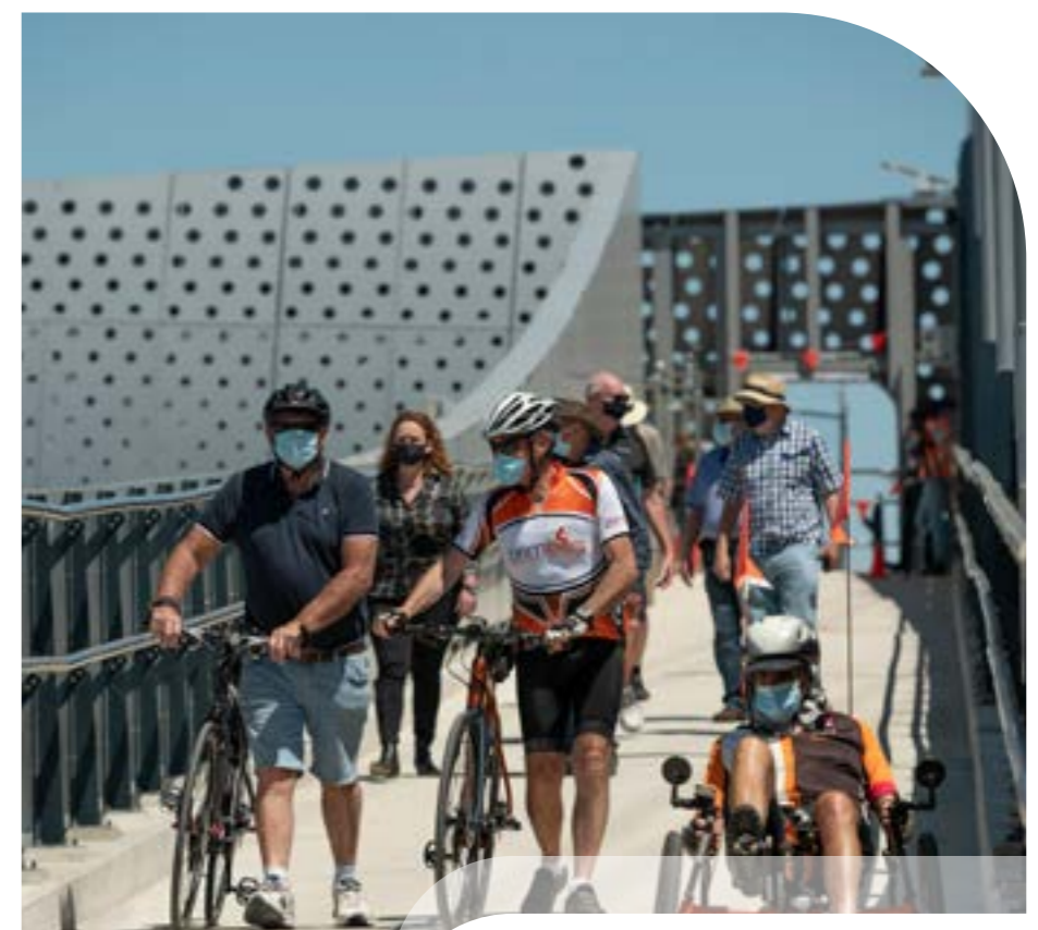
Μέλη της Κοινοτικής Διαβουλευτικής Ομάδας του Έργου της Σήραγγας West Gate χρησιμοποιούν την καινούργια πεζογέφυρα που συνδέει το Brooklyn με το Altona North.