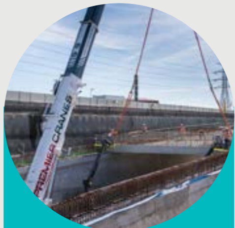
Τοποθέτηση του καταστρώματος οροφής στην έξοδο της εξερχόμενης σήραγγας στο West Gate Freeway.