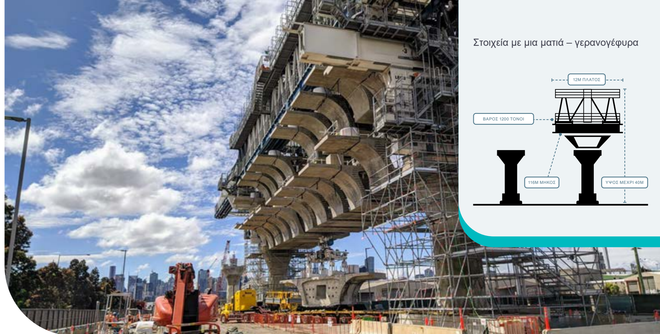
Στοιχεία με μια ματιά – γερανογέφυρα