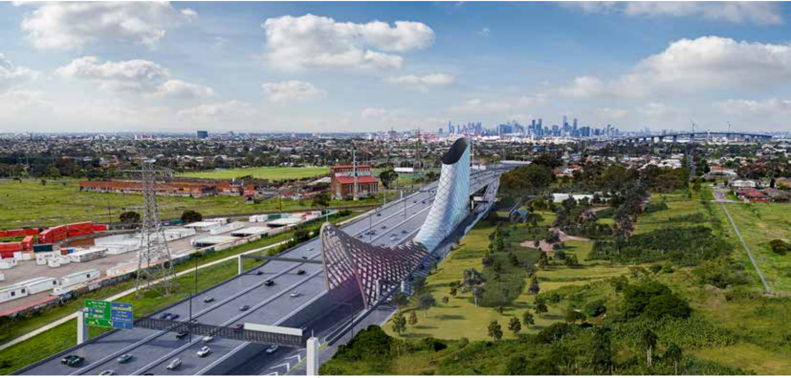
انطباع الفنان فقط - لا يشمل التصميم التفصيلي