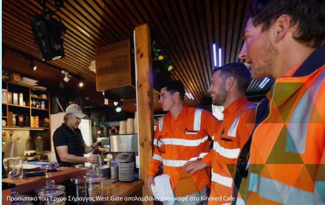
Προσωπικό του Έργου Σήραγγας West Gate απολαμβάνει έναν καφέ στο Kindred Cafe

Η μετεγκατάσταση του Κεντρικού Υπόνομου της North Yarra επί της Whitehall Street στο Footscray/Yarraville θα δημιουργήσει παρακάμψεις της κυκλοφορίας στην περιοχή για 12 μήνες.